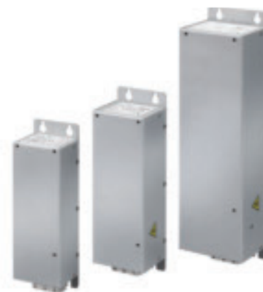
Типоразмеры 3 различных типоразмера линейных фильтров соответствуют исполнениям M1, M2 и M3 VLT® Micro Drive.